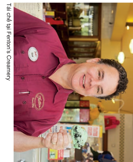
Tại chế tại Fenton's Creamery

Gọi WMAC (510) 613-8700 hoặc gửi thư điện tử đến: csnorthbay@wm.com