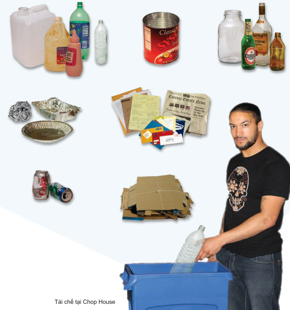
Tái chế tại Chop House

Tái chế hộp nhựa, hộp đựng thực phẩm bằng kim loại/nhôm, bìa cứng, giấy bóng kính, hộp đựng thức ăn và nước uống bằng thủy tinh