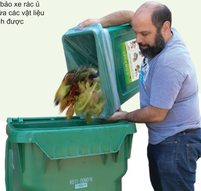
Ủ phân xanh tại Calavera