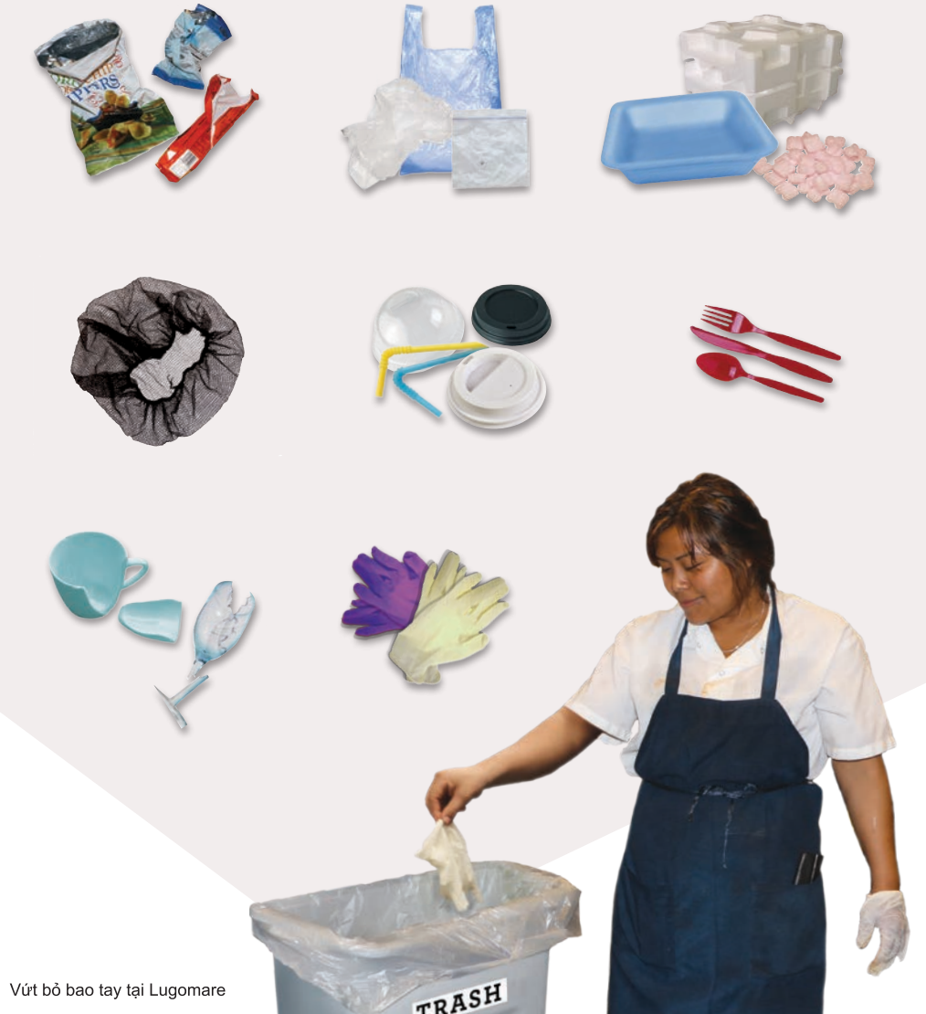
Vứt bỏ bao tay tại Lugomare

Các Loại Rác Không Thể Tái Chế Được & Không Độc Hại